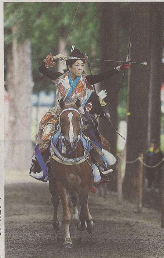
馬を走らせながら的を狙う射手 ＝11日、八戸市の櫛引八幡宮